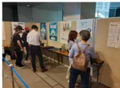
全国豊かな海づくりフェスティバル@札幌