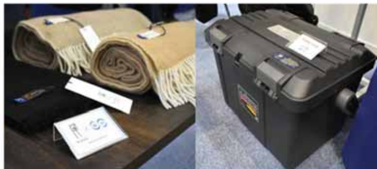
↑毛織物や射出成型したツールボックスなどの試作品も初出店