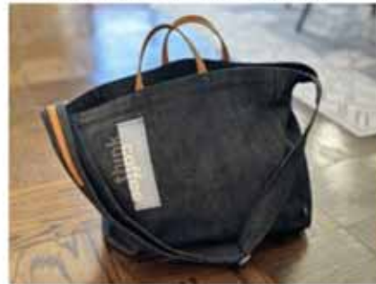
Think Coffee トートバッグ発表会