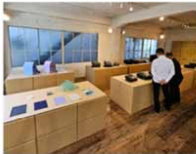
豊岡鞆 Artphere 新商品発表会