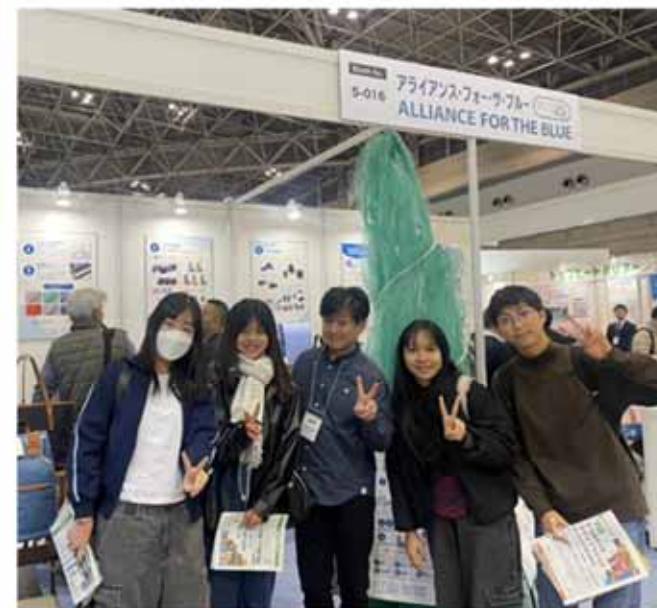
↑アジア各国からの留学生など多様で熱心な来場者