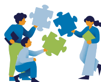
新しい視野・視座