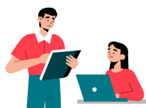
地域連携のヒント