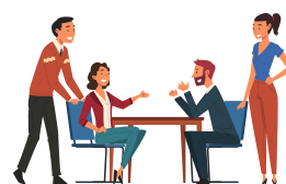
全国とのつながり