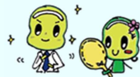
④ 身だしなみセミナー