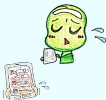
⑨ スマートフォンの 安全な使い方