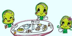
⑦ (中華) テーブルマナー