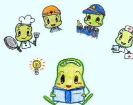
⑤ 職業適性セミナー