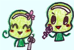
⑬ 振り返りと各自発表