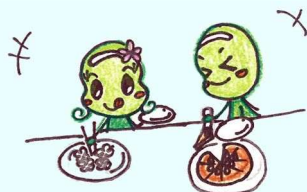
② ビュッフェのマナー