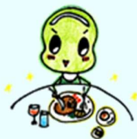
⑭ (洋食) テーブルマナー