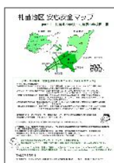
安心安全マップ part.1 札苗北・札苗緑小学校区編 2008.04 発行