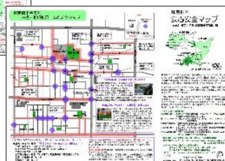
安心安全マップ part.2 東苗穂・札苗小学校区編 2009.04 発行