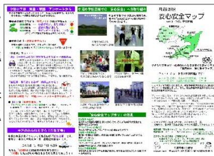
安心安全マップ part.3 中沼小学校区編 2010.04 発行

札苗地区のまちづくり活動を行っている「モエレまちづくり委員会」では、2007年度から3年間をかけて「札苗地区安心安全マップ」を作成しました。2010年4月発行の「part.3 中沼小学校区編」も完成！中沼連町には全戸配布、札苗・東雁来連町には回覧します。これから、地域で、学校で、このマップが活用されることを願っています。