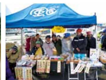
▲就労継続支援B型事業所 風舎 「地域イベント販売風景」