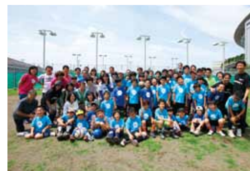
▲ CPサッカー・エスペランサのメンバーと共に

私自身も、社会貢献表彰を受賞したことを励みにし、今まで以上に様々なことを学び・経験し、向上心を持って子供たちとともに成長し続けたいと思います。