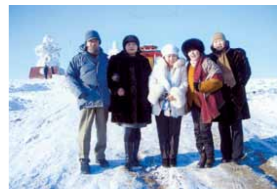
▲2005年1月 -30℃ 4人女性医師サポーター モンゴルダurlハン