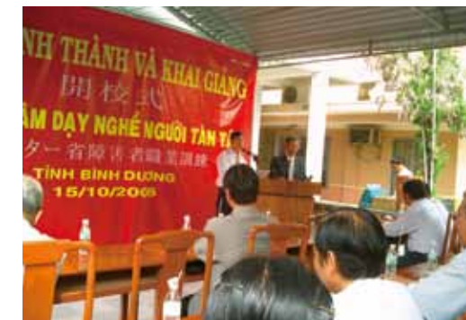
▲ 障がい者の為の職業訓練センターの開校式 2006年10月