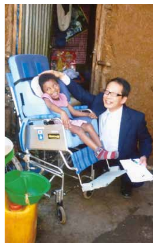
▲エチオピア バハルダールにて車椅子を贈呈し家庭訪問