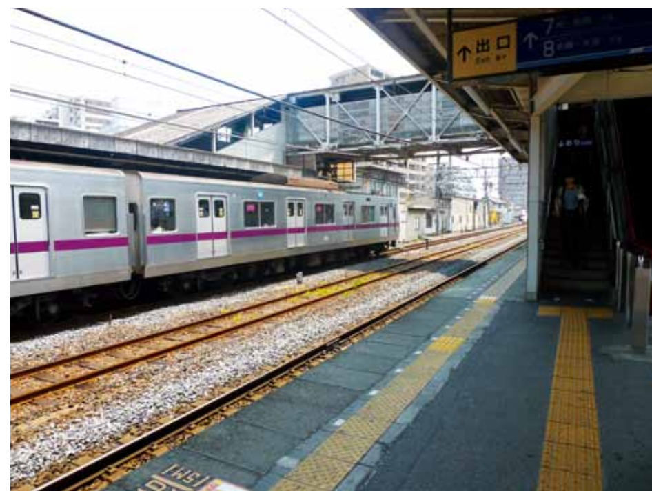
▲男性は階段を下りて来てフラフラと歩き線路へ転落した