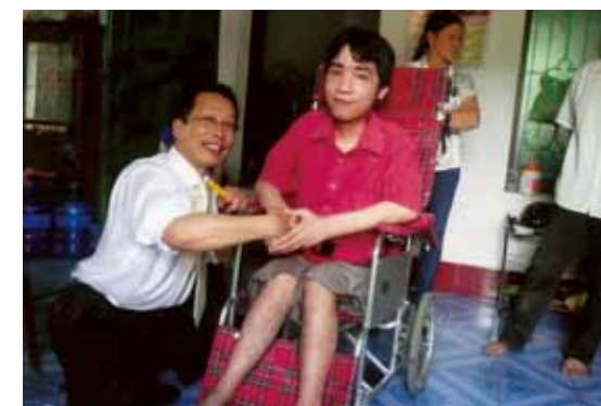
▲枯葉剤の影響で歩けぬ青年へ贈呈（ハノイ北200kmの山村）