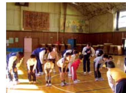
▲ 「苦手教室」での準備体操