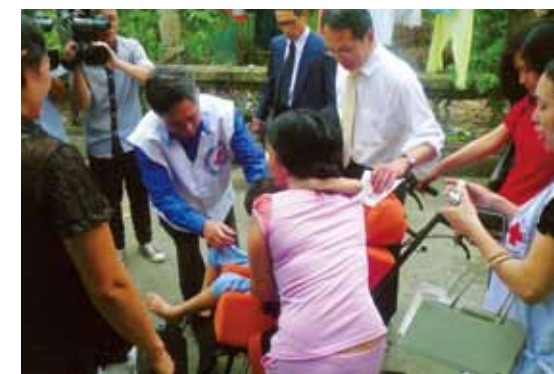
▲ベトナム赤十字が受けてとなり贈呈 ハノイ近郊で家庭訪問