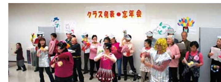
▲クラス発表・忘年会