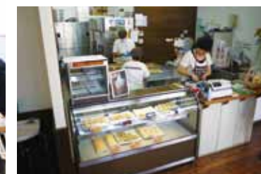
▲就労継続支援B型事業所 Croquette.(クロケット.) 「コロケ製造販売風景」