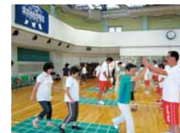
▲ 高齢者対象の健康体操 (スマフィット)