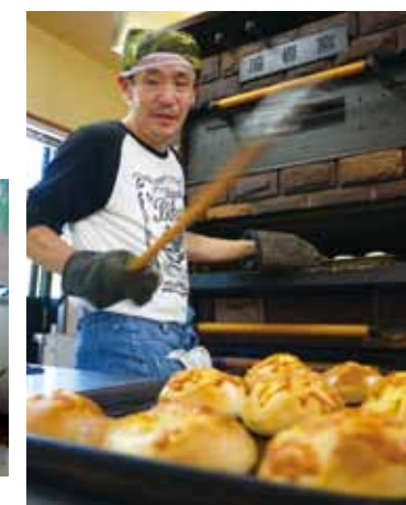
▲就労継続支援B型事業所 風舎 「天然酵母パン製造風景」