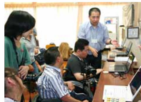
▲ デモンストレーション（平成24年9月）