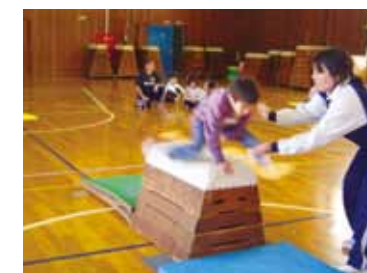
▲ 「苦手教室」での跳び箱