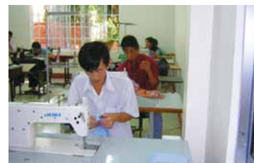
▲ センター内の縫製教室