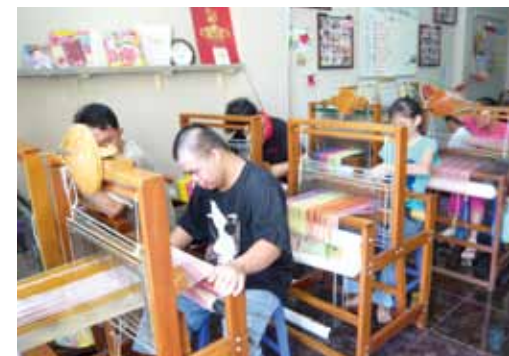
▲ G-CoCoRo みんなでこころ織り