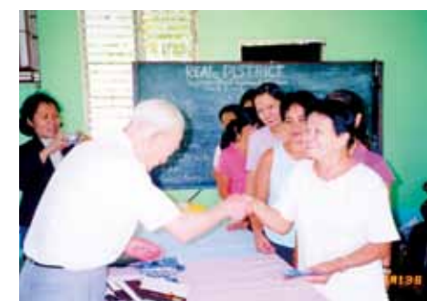
▲ フィリピンでの活動の様子