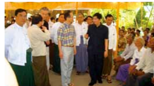
▲ 2008年5月、第18回ミャンマー眼科医療活動。マンダレー眼科病院で、保健省主催の無料眼科検診、無料白内障手術が行われた。6000名を超える患者さんが来て、ミャンマー眼科医12名と一緒に約400名の白内障手術を行った。写真は、チョー・ミン保健大臣とともに術前の患者さんを回診しているところ