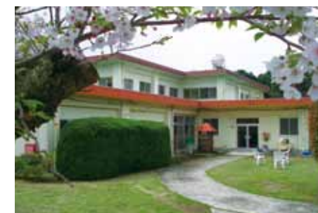
▲ 更生保護施設「雲仙・虹」外観