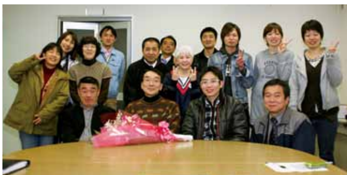
▲ながさきコミュニケーションエイド研究会定例会にて（平成24年3月）

をと思って作り始めたのですが、公開してみると、全国でたくさんの人たちが使ってくださり、皆さんからはたくさんの要望が寄せられ、それらに応えてきた結果、多くの機能を有するものになりました。今では、インターネットはもちろん、Windowsで