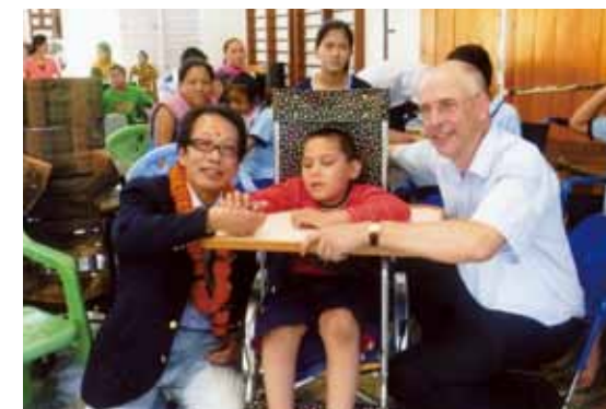
▲ネパール ボカラにて贈呈式（現地NGOへ100台贈呈）