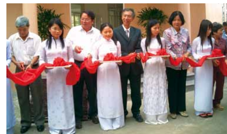
▲ 職業訓練センターの開校式典・テープカット