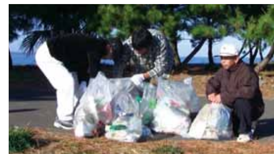
▲ ボランティア活動(海岸 公園 道路の清掃活動)