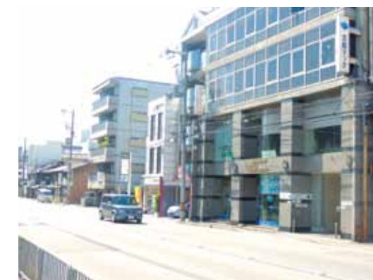
▲ 建物外観・京都水族館近く