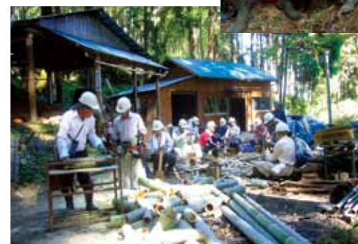
▲育林市民力養成講座（炭焼き準備）