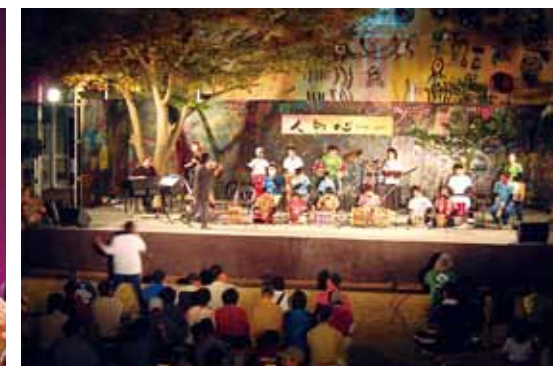
▲ 地域交流フェスタ in しょうぶ