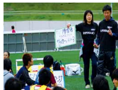
▲ イベントでのワークショップの様子