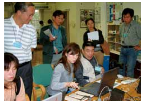
▲ コミケンフォーラムで（平成17年11月）