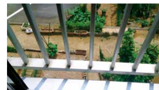
▲男児の首が挟まった格子