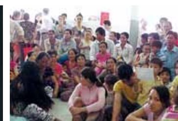
▲診察を待つ患者と親 ベトナム ベンチェ省