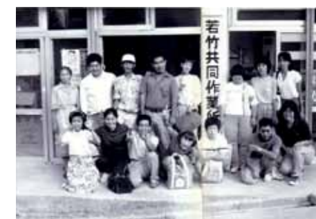
▲ 82年 若竹共同作業所 開所式