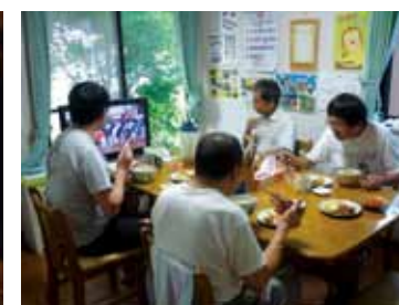
▲グループホーム・ケアホーム 食事風景