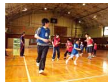
▲ 発達障害児の運動教室 「運動が苦手な子の教室」でのリレー