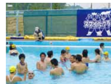
▲ 「苦手教室」のプールイベント (柏高校学生ボランティア)