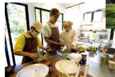
▲ レストラン就労支援