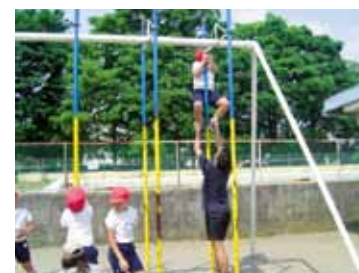
▲ 柏市協働事業「学校体育授業サポート」で 小学校の体育サポート