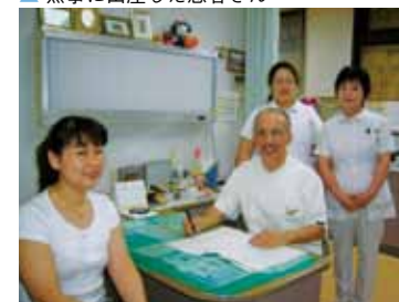
▲スタッフの皆さんと