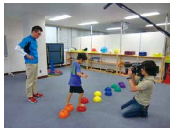
▲バランス感覚のトレーニング