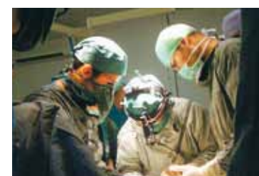
▲手術指導中 チュニジア