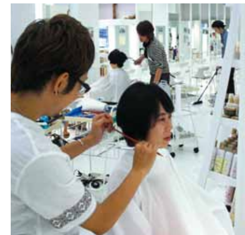
▲1日限りのチャリティー美容室「スネガビーク」。収益金を被災地支援にあてる