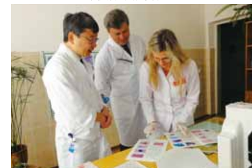
▲細胞診断用の症例集を露訳した資料を現地の医療機関へ贈呈