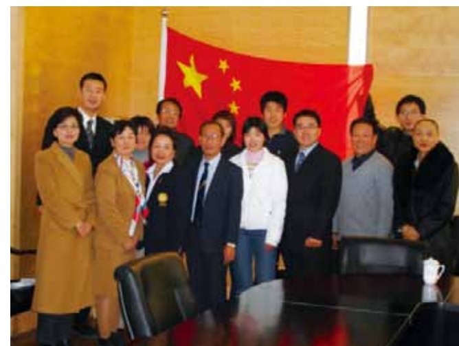
▲ 2006年中国北京体育大学でのアジア障害者スポーツ指導者ネットワーク