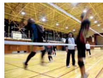
▲ バレーボール教室