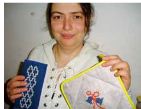
▲チェルノブイリ原発事故被災者が働く福祉工房「のぞみ21」支援