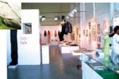
▲ アメリカでの展示会 2003.fabulous fabrics