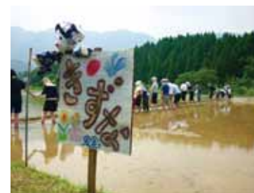
▲社会福祉法人 風舎 「地域交流 田植え風景」