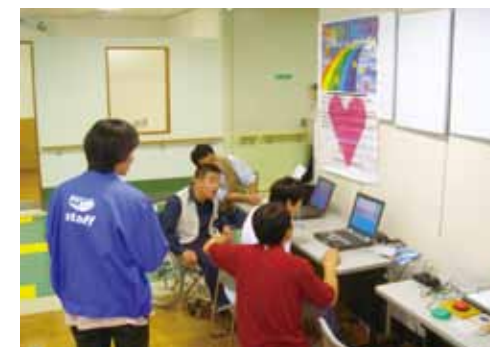
▲ 福岡県古賀市健康福祉まつりでのデモ（平成16年10月）