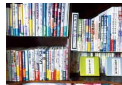
▲ 録音の資料となる相撲に関する書籍類