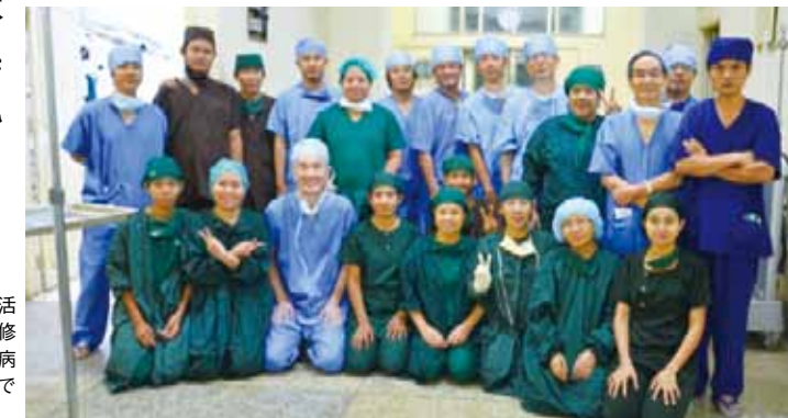
▶ 2012年10月、第22回ミャンマー眼科医療活動。超音波白内障手術、網膜硝子体手術、研修医のトレーニングが終わって、ヤンゴン眼科病院の医師、看護師、技術者と手術室前の廊下で記念撮影

超音波白内障手術の知識が少なかったこと、装置が高価で購入しにくかったこと、旧来の白内障手術に慣れていたことなどから、最初の訪緬時に私たちが行った超音波白内障手術は驚きを持って迎え入れられました。それから14年間におよぶ活動で多くの現地医師が超音波白内障手術手技をマスターし、白内障で光を失う方への医療に取り組んでいます。今後もさらにミャンマーでの超音波白内障手術の普及に努め、日本のように、すべての眼科医が超音波白内障手術のできる体制作りに貢献をしたいと思えます。今回の受賞がきっかけで、さらに活動を継続させていく勇気をいただきました。社会貢献支援財団およびそれに関係する多くの方に心よりお礼を申し上げます。