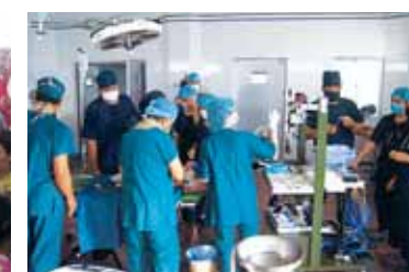
▲準備中の手術室 チュニジア