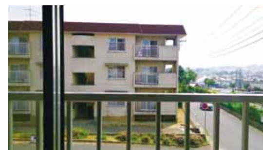
▲河野宅からみた現場