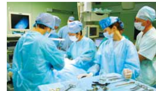
▲ベラルーシでの甲状腺内視鏡手術