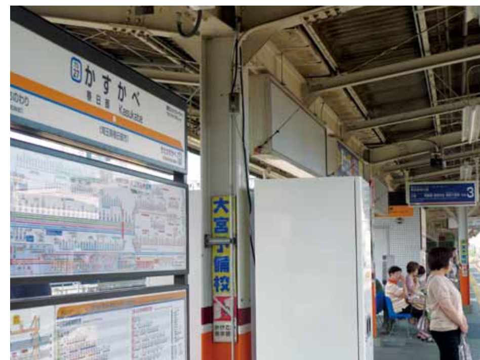
▲東武伊勢崎線（現東京スカイツリーライン）春日部駅3番線ホーム