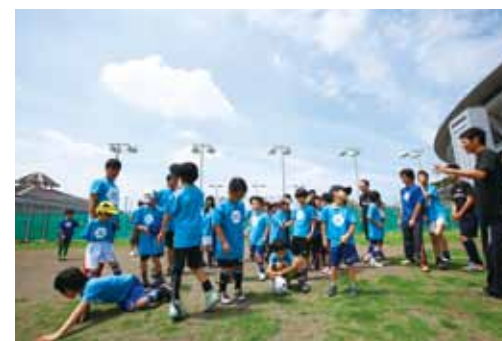
▲ エスペランサのキッズ・ジュニアサッカースタート