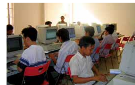
▲ センター内のパソコン教室