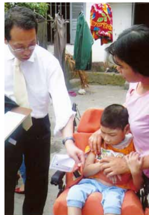
▲ベトナム ハノイ北200kmの山村へ家庭訪問