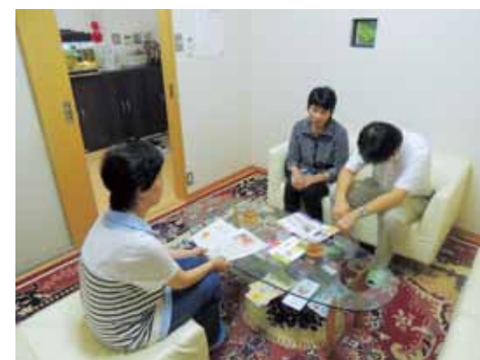
▲ 依存症相談の様子