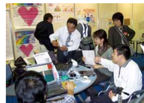
▲ 西日本国際福祉機器展でのデモ（平成16年11月）