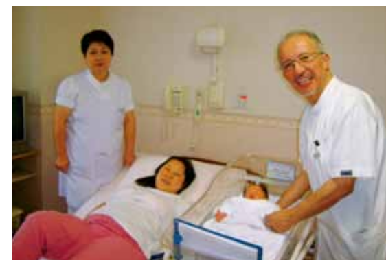
▲無事に出産した患者さん