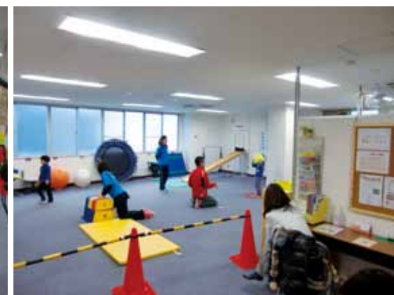
▲保護者が見守る中療育が行なわれる