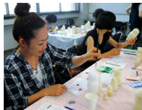
▲マトリョーシカ絵付け会