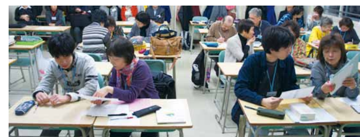
▲じっくりクラスの授業風景