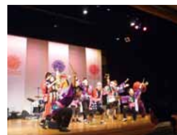
▲生活介護事業所 風舎つるまち 「ちんどん way 公演風景」