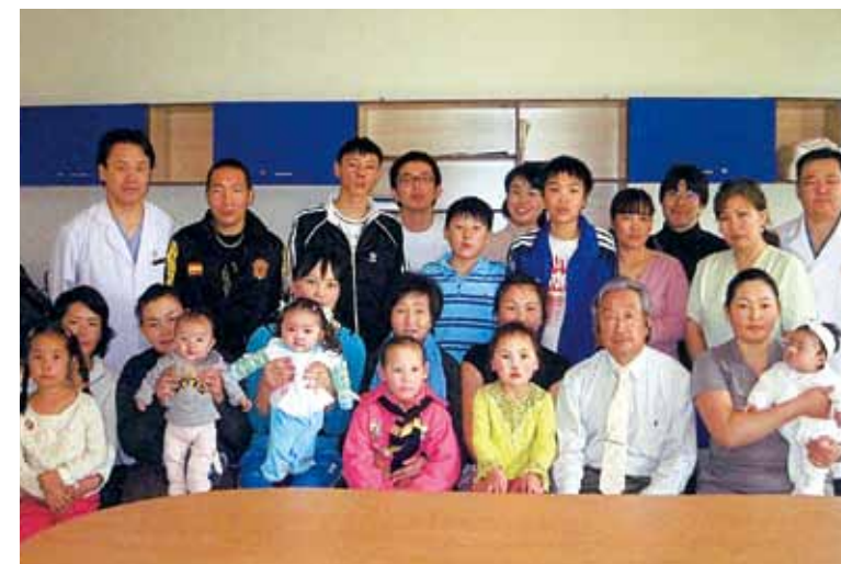
▲手術後の子供達と母親 モンゴル

このように色々な国で手術ができたのは、一緒に日本から私と一緒に外国に行ってくれる仲間や麻酔医、看護師さんたちがいるからで、この賞を頂いた折にそれらの人たちに感謝したい。