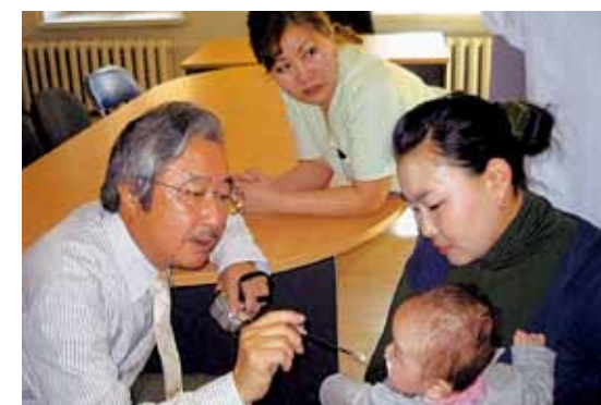
▲術後患者診察 モンゴル