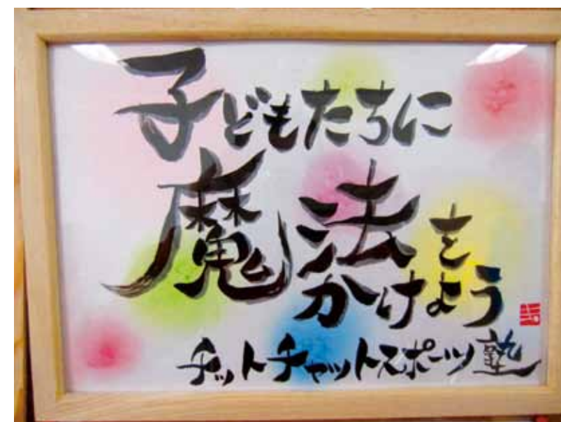
▲キャッチフレーズ