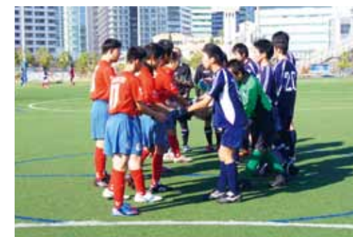
▲ 姉妹クラブ・韓国ゴムドゥリ蹴球団との交流試合