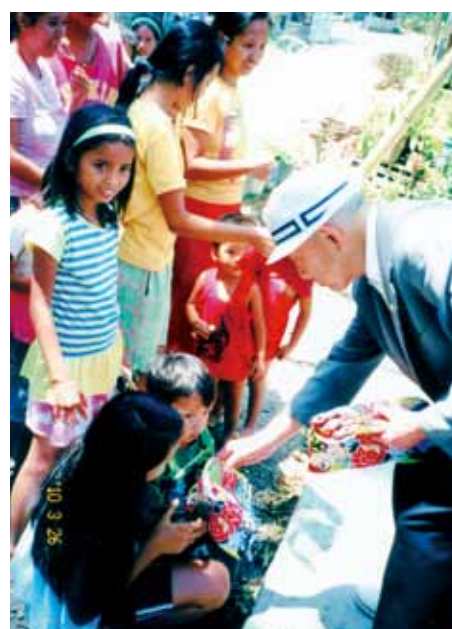
▲ 歓迎する子供たち

9月6日太平洋岸インファンタ町で武装解除を受けたが、ここに着くまで路の両側に並んだ現地人の増悪に満ちた眼差しは、忘れられないという。そして乗せられた上陸用舟艇にはためく米国旗を見て「本当に日本は負けたのだ」と知った。更にカンルーバンの捕虜収容所まで乗せられた無蓋トラックに沿道から「バカヤロウ」などの罵声を浴びせられ、沢山の小石も投げ