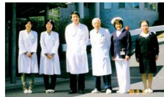
▲ 院長を勧める病院前で