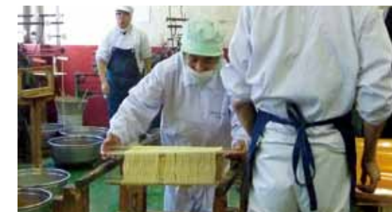
▲ そうめんを作る入所者