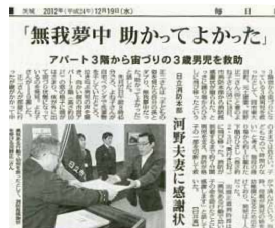
▲毎日新聞 2012 年 12 月 19 日