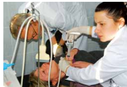
▲ベラルーシでの甲状腺がん検診

今回の表彰によって、我々の活動が多くの人々の目に留まり、支援の輪が広がっていくことを期待しております。今回は大変ありがとうございました。