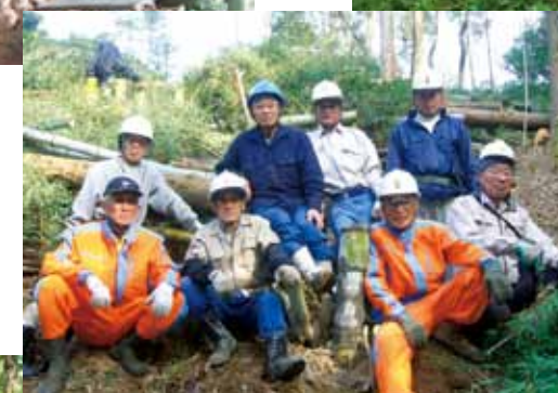
◀完伐後の会員たち