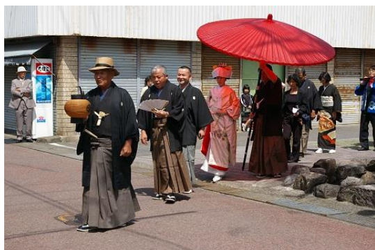
地域伝統の結婚式を再現