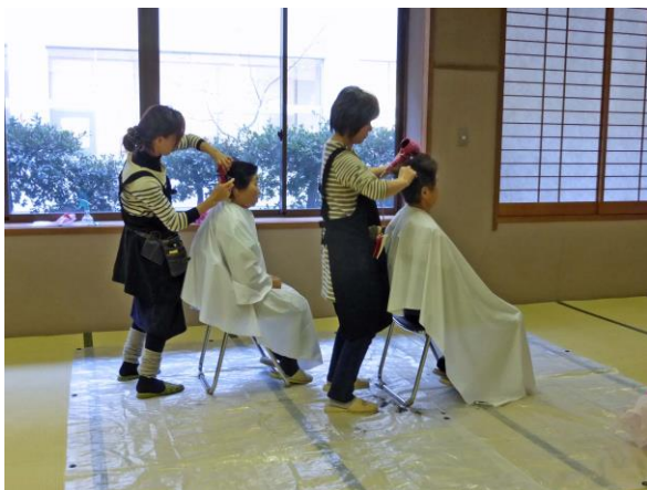
プロの美容師が来ています。

瀬戸内海の島々は、人口の少ない島が多く高齢者が多いのですが皆とても元気で、理容室美容室の無い島では近くの町に買い物に行くついでに、美容室理容室に寄るそうです。私達の訪問は設備が充分ではありませんが、移動しなくても良いので大変喜ばれています。檀石島には、有名な勝海舟の派米咸臨丸に三十五名の塩飽水主が乗って、荒海を乗り越えた事を讃えた石碑があります。