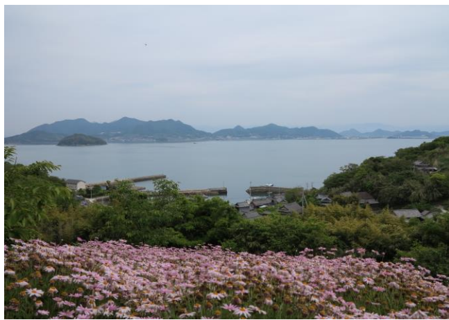
今でもご夫婦で花を栽培されています

志々島に出張美容に行きました 香川県三豊市詫間町にある人口二十人の志々島には美容室も理容室もありません。島のご婦人は、フェリーで宅間町や丸亀市の美容室に行きます。島から出かける時帰りのフェリーの時が気になります。今日は美容師が来てくれたので、島の中でゆったりと美容が受けれると喜んでいました。島では大きな千年楠が威風堂々と立っていました。昔は花の栽培が有名で春には島一面の花畑があったそうです。