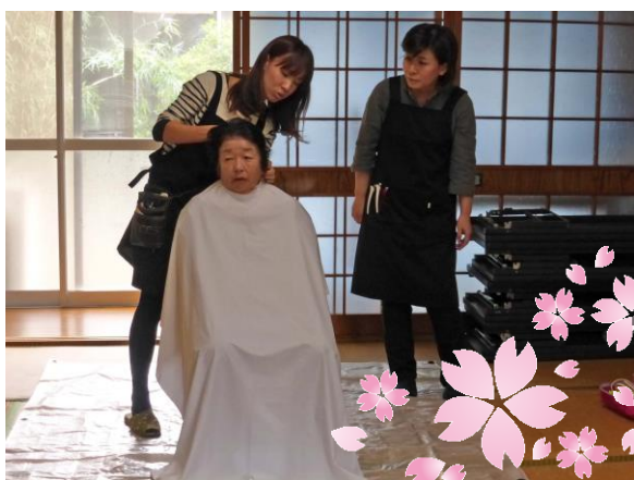
福田では集会場で美容をしています。