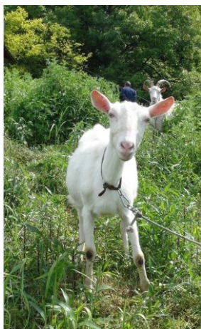
志々島の山頂のヤギ