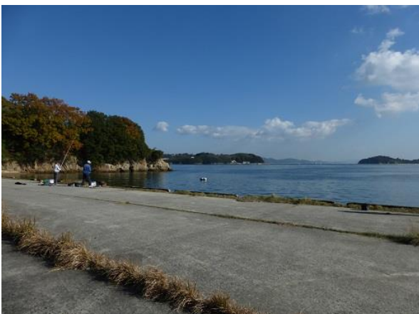
檀石島の隣は岡山県児島が見えます。