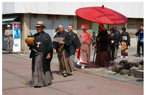
地域伝統の結婚式を再現