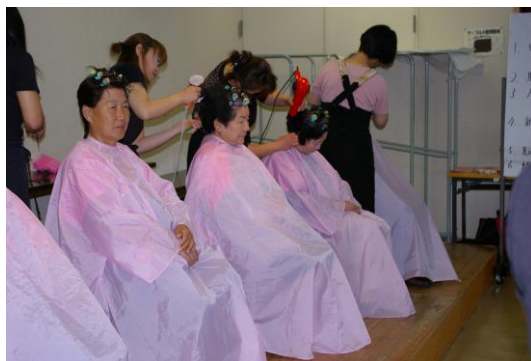
メイクと美容の講習会