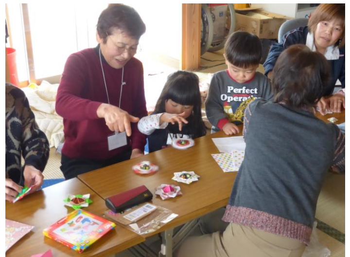
安居島のデイサービスには家族が遊びに来ていました。