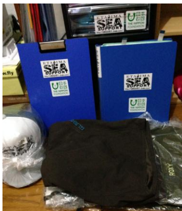
ステッカー、帽子の制作