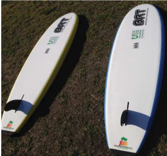
ニッパーボード (子ども用パドルボード)