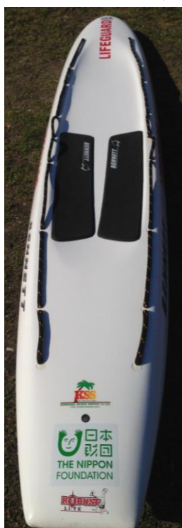
レスキューボード