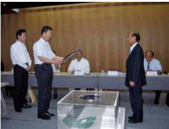
神奈川県遊技場防犯協力会連合会