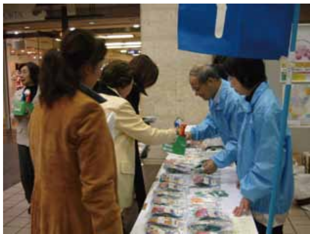
募金ありがとうございます