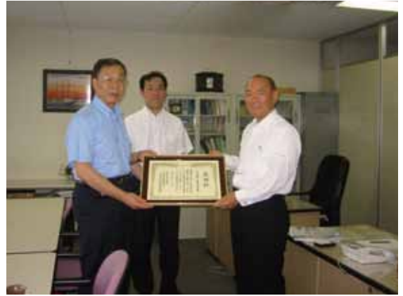
(社)神奈川県警備業協会