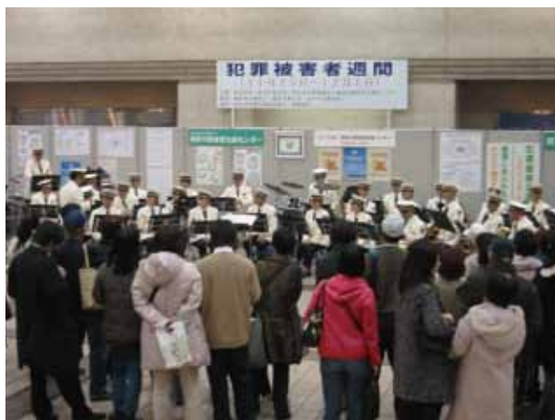
神奈川県警音楽隊