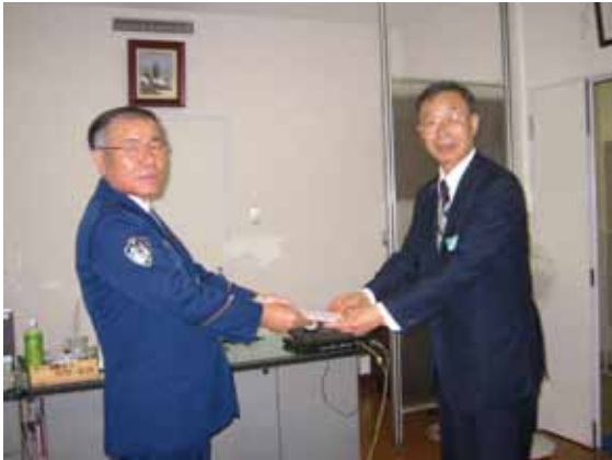
瀬谷警察署親和会