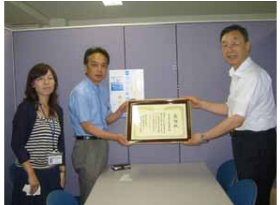
横浜駅西口振興協議会