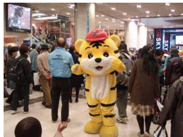
人気者のトラちゃん