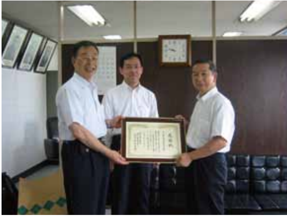
(社)神奈川県指定自動車教習所