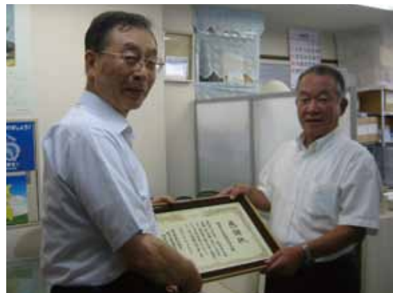
神奈川県自転車防犯協会