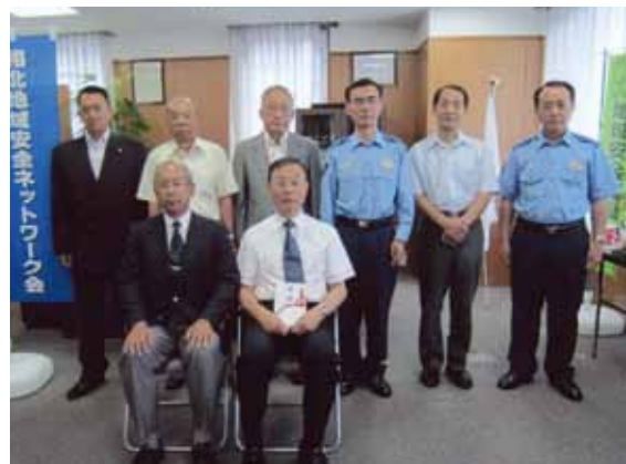
相北地域安全ネットワーク会