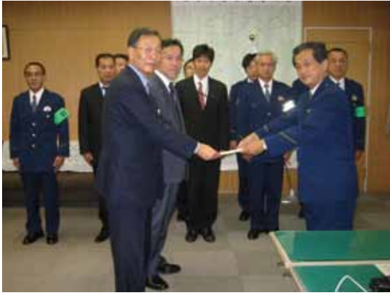
海老名警察署親睦会