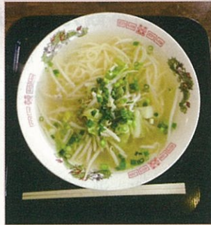
門司港名物 チャンラー