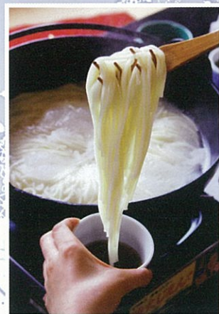
五島うどん地獄炊き (新五島町)