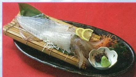
あしやんいか（北九州エリア）