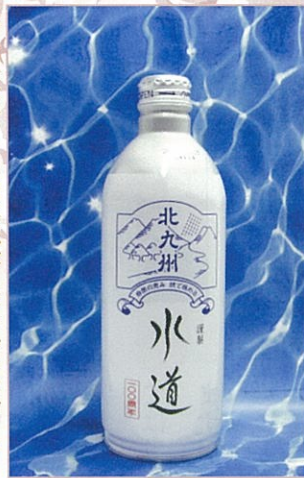
北九州水道100周年記念 ボトルドウォーター 「自然の恵み 技で極める 北九州 水道」