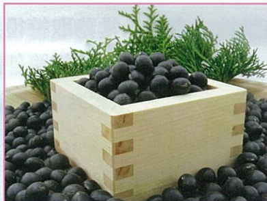
特産品の筑前クロダマル