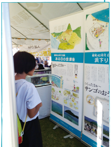
※展示に協力していただける方を募集しています。