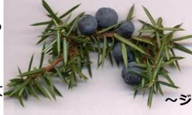
～ジュニパーベリー～