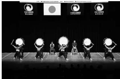
(太鼓集団天邪鬼・東京)