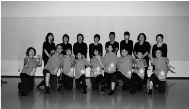
(初出場の和太鼓 龍船 昂・京都)