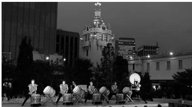
(邦楽アカデミー和太鼓大元組)

9月3日(水)日本財団の関連団体で構成されている水心会が親睦を目的に開催している恒例の夏祭りが行われました。昨年は生憎の雨で中止となりましたが、今年は秋晴れの中、東京日本橋の三越本店屋上ビアガーデンで行われました。今回も当財団に要請があり、太鼓2チームが出演しました。東京の「邦楽アカデミー和太鼓大元組」と共に、日本財団関連団体関係者で構成された「和太鼓水心会」が会場内ステージで演奏し、夏祭りを大いに盛り上げました。日ごろの練習の成果に参加者から盛大な拍手がおくられ、仕事を離れた仲間たちの勇姿に会場は大喜びでした。都会のビルの屋上で、秋を感じるさわやかな風が吹き抜ける中、演奏者の方々も気持ちよく太鼓をたたいていました。