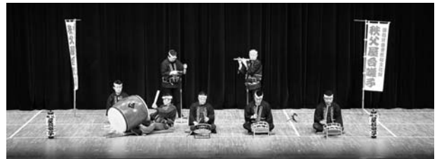
(秩父屋台囃子若葉会・埼玉)