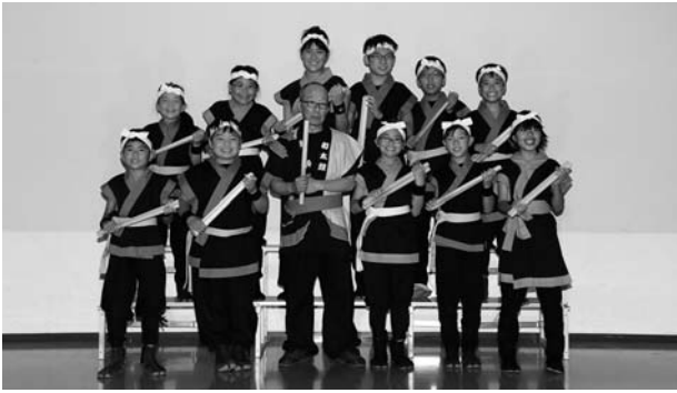
(初出場の山城ノ國 和太鼓 鼓粋「絆」・大阪)