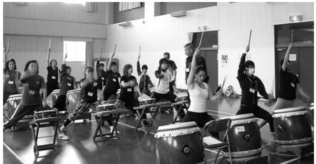
(3級基本講座の様子)