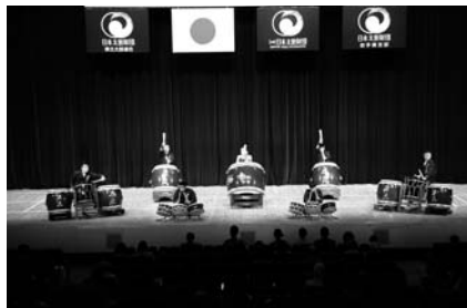
(豊の国ゆふいん源流太鼓・大分)