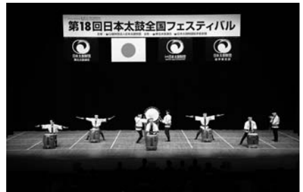
(越中いさみ太鼓保存会・富山)