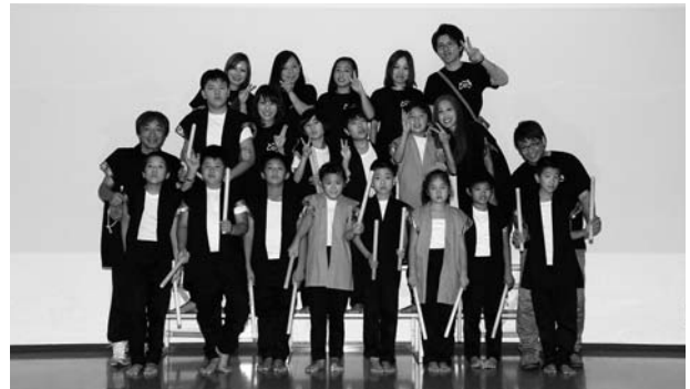
(初出場のライフサポートあんしん 和太鼓教室 ひびき・奈良)