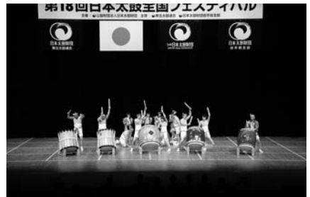
(気仙町けんか七夕保存会・岩手)