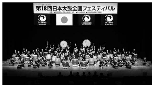
(岩手県合同チーム)

最後になりますが、演奏して下さいました各団体の打ち手の方々、ご来場下さいましたお客様、全ての皆様方に重ねて厚く感謝と御礼を申し上げます。ありがとうございました。