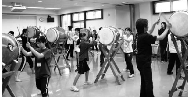
(御諏訪太鼓講座の様子)

1級検定 20名受験 20名合格(4名認定) 2級検定 18名受験 18名合格(8名認定) 3級検定 14名受験 14名合格 4級検定 9名受験 9名合格 5級検定 41名受験 41名合格