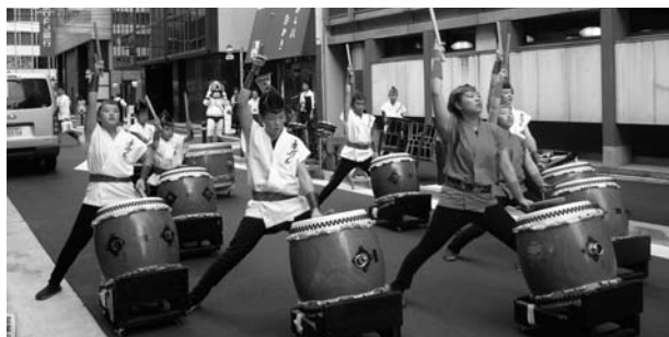
(邦楽アカデミー和太鼓大元組ジュニア)

オフィスビル街での夏祭りの太鼓演奏に、家路に向かう人々も足を止め、夏の暑さを一時忘れ楽しんでおられました。