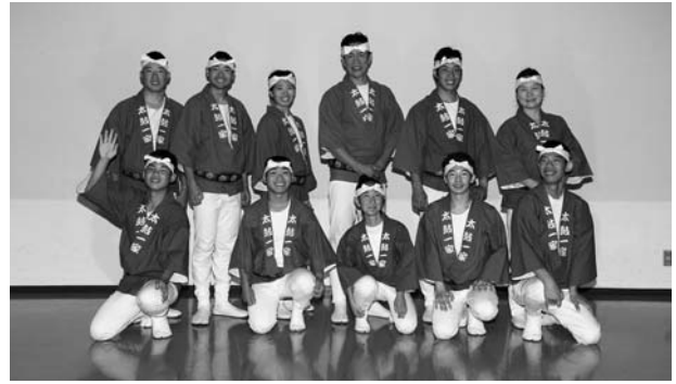
(初出場のNPO法人太鼓の楽校 太鼓一家“虹”・徳島)