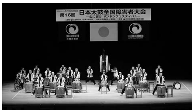
(16回連続出場の恵那のまつり太鼓・岐阜)