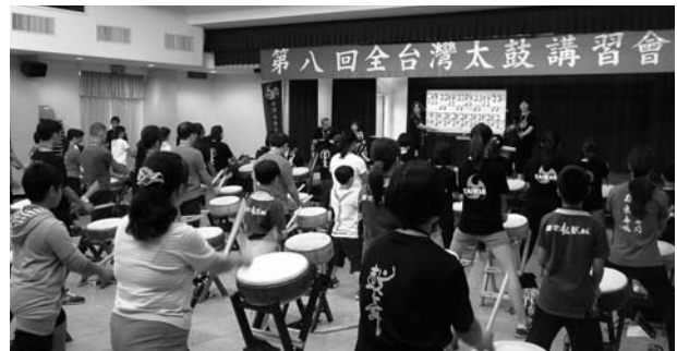
(5級基本講座の様子)

3級検定 42名受験 42名合格 4級検定 36名受験 31名合格 5級検定 61名受験 61名合格