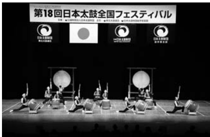
(岩代國郡山うねめ太鼓保存会小若組・福島)