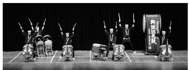
(御諏訪太鼓保存会・長野)