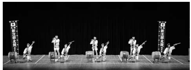
(尾張新次郎太鼓保存会・愛知)