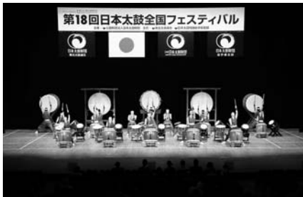
(富岳太鼓竜神組・静岡)