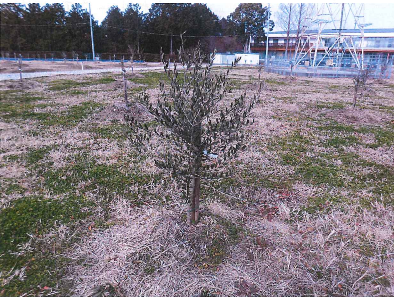
オリーブ成長の様子