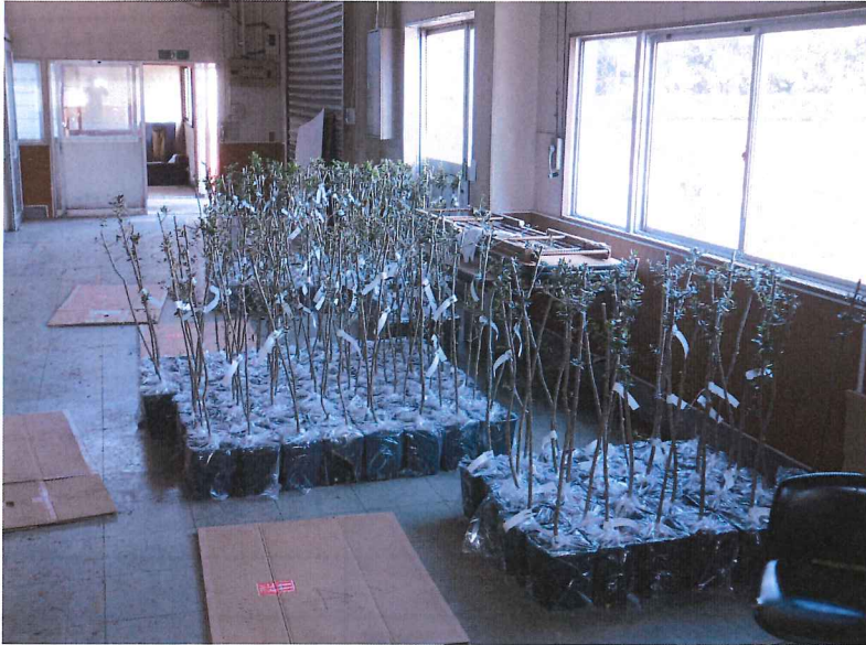
オリーブの苗が納品 される H26.4.22