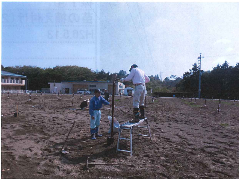
オリーブの植樹の 様子① さし木の設置 H26.5.13