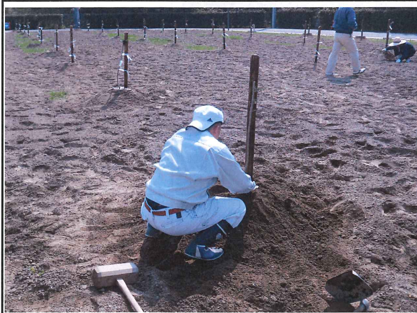
オリーブの植樹の 様子④ 苗の植え付け(2) H26.5.13