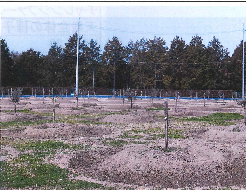
チャレンジファーム