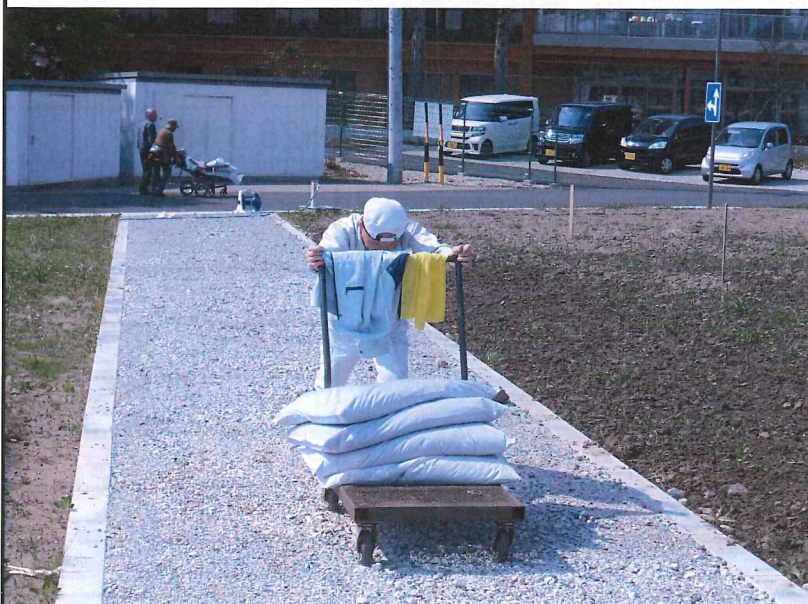
オリーブの植樹の 様子② 用土を運ぶ H26.5.13