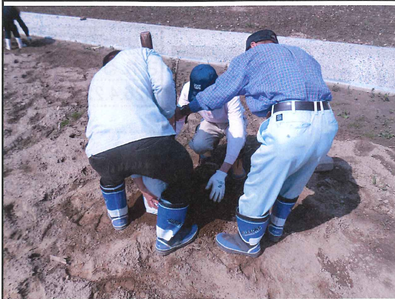
オリーブの植樹の 様子③ 苗の植え付け(1) H26.5.13