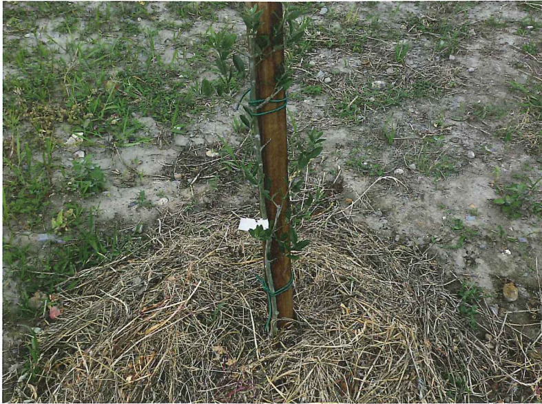
オリーブ成長の様子