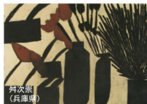
はたよしこ (兵庫県)

イベント開催日は、最寄りのJR駅から無料のジャンボタクシーを随時運行しています。11/1、2、3はシャトルバス運行予定。詳細が次ページに掲載します。