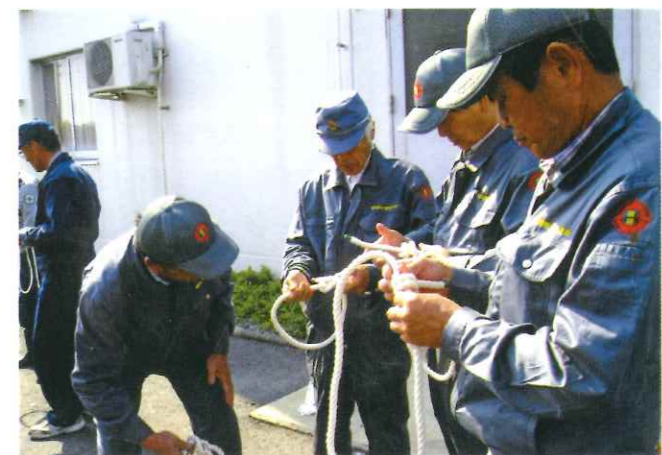
ロープの結索訓練の様子