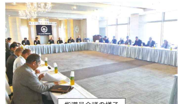
指導員会議の様子