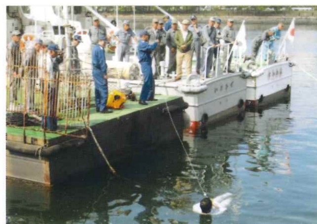
浮くっチャボトルを使用する訓練