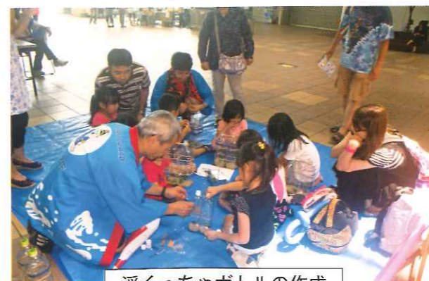
浮くっちゃボトルの作成