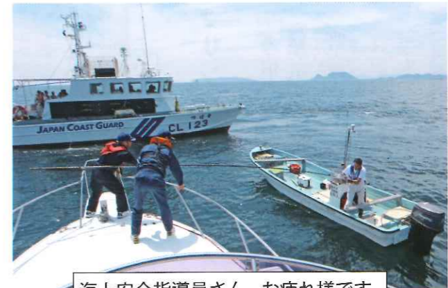
海上安全指導員さん、お疲れ様です。

海上安全合同パトロール 海上安全合同パトロールを各保安部署のご協力を得て、役員立合いのもと各地区で実施した。大変お疲れ様でした。