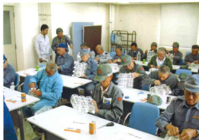
浮くっチャボトルの制作の様子

当小安協の活動をご紹介します。 毎年、当小安協は事業計画を立てて実施しております。 七月二十七日(日)三池海上保安部の巡視艇とパトロール艇四艇でキス釣り船が多い海域をパトロールし、訪船指導、海難防止強調運動のチラシを配布し安全意識の高揚に努めています。 十月二十六日(日)日頃使用しているロープの結索訓練を行いました。六種類の結索訓練では普段使っていないものもあり、講師の指導や仲間と話し合いながら楽しく訓練が出来ました。続いて各自持参の二リットルのペットボトル四本を使って浮くっチャボトルの制作を行いました。次に浮くっチャボトルの使用訓練を行いました。終了しました。以上、当小安協の年間行事をご紹介します。 今年も海の安全を願って事業計画を立て活動をしていきたいと思ひます