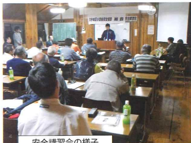
安全講習会の様子