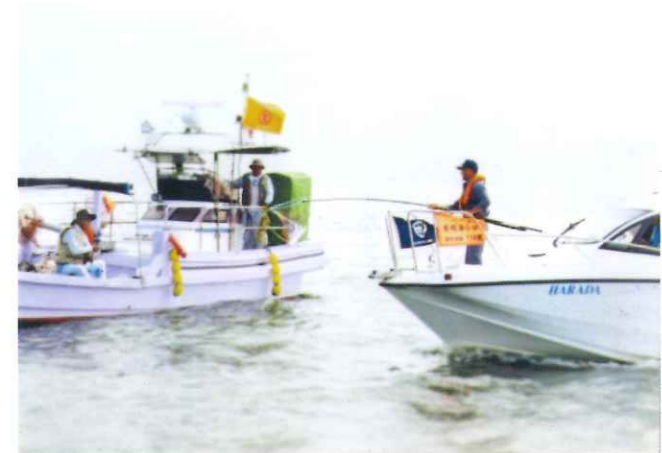
合同パトロールの様子