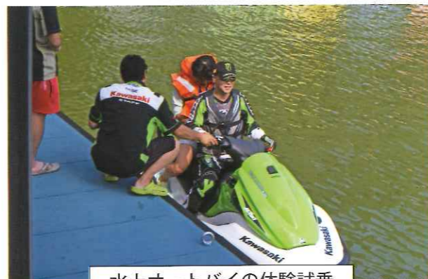
水上オートバイの体験試乗

事務局より 第七管区海上保安本部・各保安部署の皆様、そして民間からの講師の方々には、ご協力を頂きまして本当に感謝いたしております。 実技講習では、受講者がとても真剣な表情で縄梯子を作成している様子や、宇部海上保安署の今までのない寸劇による講習などとても充実した講習会であったと思います。 平成二十七年度もよろしくお願いたします。 講習内容につきましては、会員皆様の要望にお応えできるよう努めて参りたいと思っております。