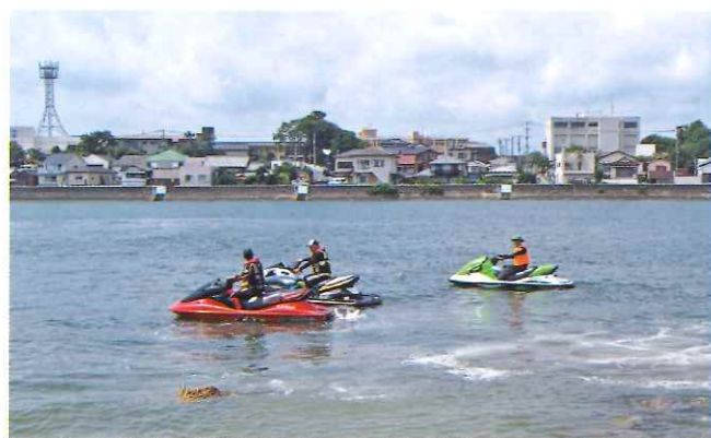
水上バイクでのパトロール

陸上における水上バイク船長及び初心者に対する安全講習 九月七日(日) 福岡県福岡市釣川河口の海岸にて、若松海上保安部の方々を講師に迎え、安全講習会を実施。 免許所持者十名とこれから水上バイクの免許を所持しようとする者十五名、計二十五名に対して海岸での危険、水上バイクにおける水難事故事例等、資料を使い、安全啓蒙活動を実施した。 特に夏場は、海水浴場で水上オートバイを操船する方達が多いため、今後も海上パトロール、安全講習会等地道な活動を行っていきたいと思っております。