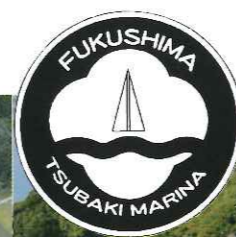
つばきマリーナ (長崎県)