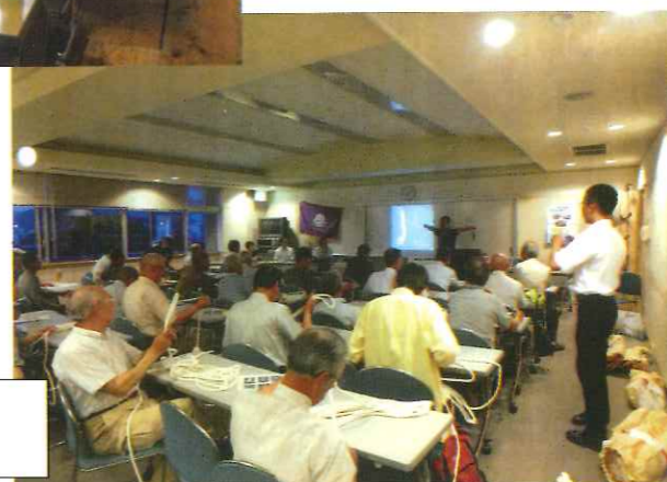
実技講習 縄梯子の作成 皆さん真剣です!

事務局より 第七管区海上保安本部・各保安部署の皆様、そして民間からの講師の方々には、ご協力を頂きまして本当に感謝いたしております。 実技講習では、受講者がとても真剣な表情で縄梯子を作成している様子や、宇部海上保安署の今までのない寸劇による講習などとても充実した講習会であったと思います。 平成二十七年度もよろしくお願いたします。 講習内容につきましては、会員皆様の要望にお応えできるよう努めて参りたいと思っております。