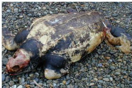
ピニール袋をまちがって食べ 死んでしまったウミガメ