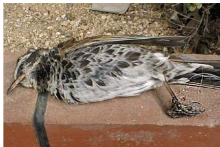
釣り人が捨てた釣り糸が 絡まって死んでしまった鳥