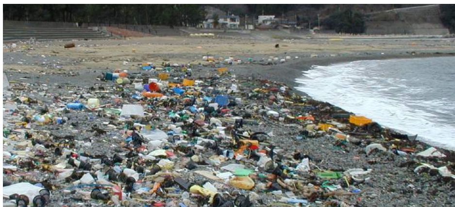
ゴミがたくさん流れついて、汚れてしまった浜辺

でも、わたしたち一人ひとりがほんの少し気をつけ れば 、海はもっときれいになる。みんなで海をきれいにするために出来ること、考えてみない？