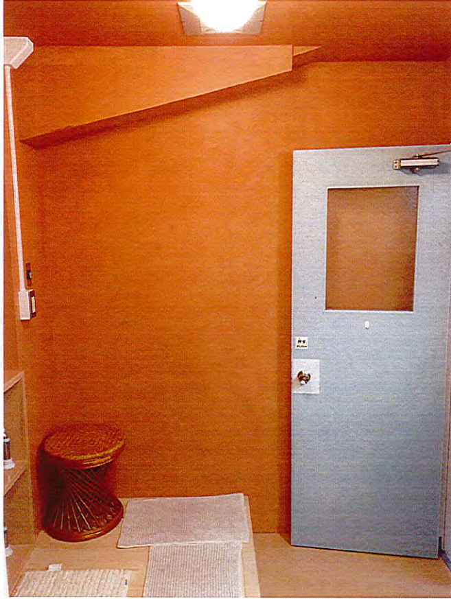
浴室直下の一階トイレ天井漏水修復