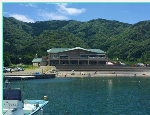
福井県海浜自然センターを海側より眺める