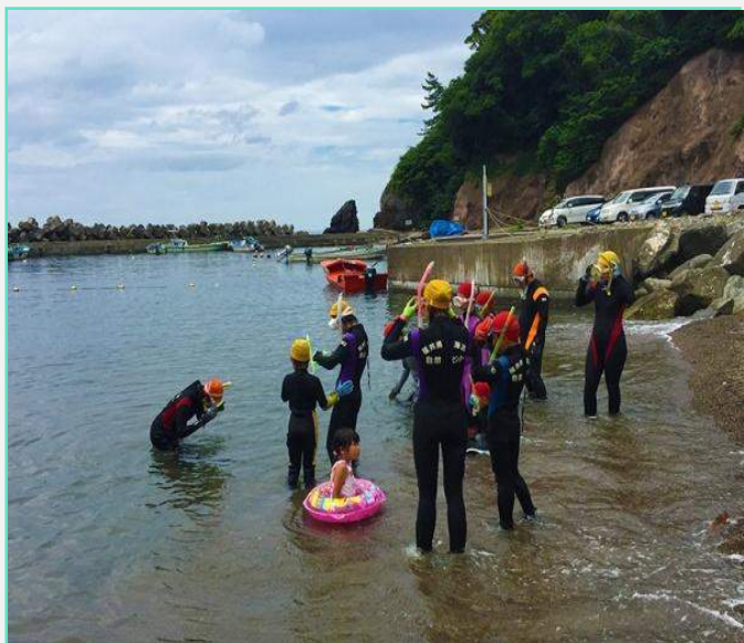
ウミウシ観察シュノーケリング 小さなウミウシを探します