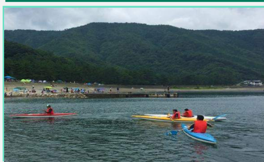
カヌー体験 なかなか 思うように 進みません