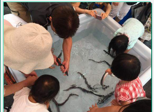
どじょうすくい ポイでどじょうをすくい 数を競います。踊りではありません。