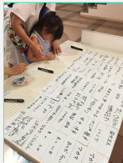
アクアリウムプロジェクト 署名中。 こんなに署名が集まりました