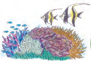
崎枝小中 小1-2年生 中学生

実施日：2014年7月10日 対象：石垣小学校 5年生 40名 実施：石垣島沿岸レジャー安全協議会 八重山漁業協同組合サンゴ養殖研究班