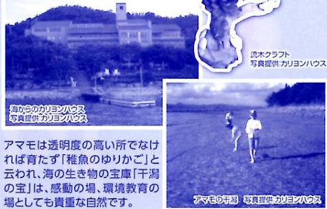
アマモは透明度の高いのでなければ育たず「稚魚のゆりかご」と云われ、海の生き物の宝庫「干潟の室」は、感動の場、環境教育の場としても貴重な自然です。

日本のエーゲ海と云われる牛窓(前島)で、海の生き物を観察しながら、楽しい夏休みの思い出をつくってみませんか？