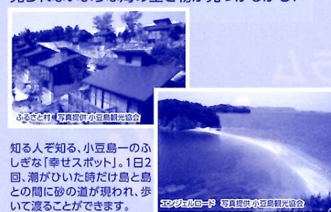
知る人ぞ知る、小豆島一のふしぎな「幸せスポット」。1日2回、潮がひいた時だけ島と島との間に砂の道が現われ、歩いて渡ることができます。

オリーブの島として有名な香川県の小豆島で、思い切り自然と遊び、都会では味わえない素朴な感動に出会えます。エンジェルロードでは干潮時には普段見られないような海の生き物が見つかるかも？