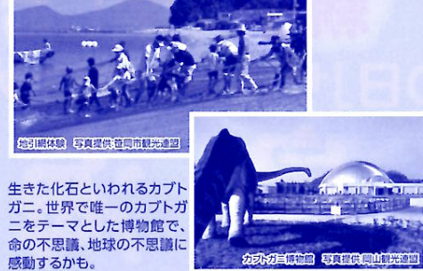
生きた化石といわれるカブトガニ。世界で唯一のカブトガニをテーマとした博物館で、命の不思議、地球の不思議に感動することも。

西部の笠岡の白石島でマリンスポーツ、漁業体験した後、国の天然記念物「カブトガニ」の観察&勉強会に参加してみませんか？