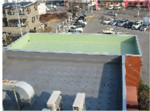
完成引渡し後の写真