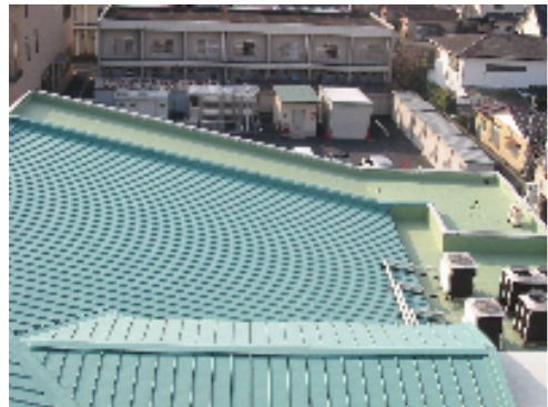
完成引渡し後の写真