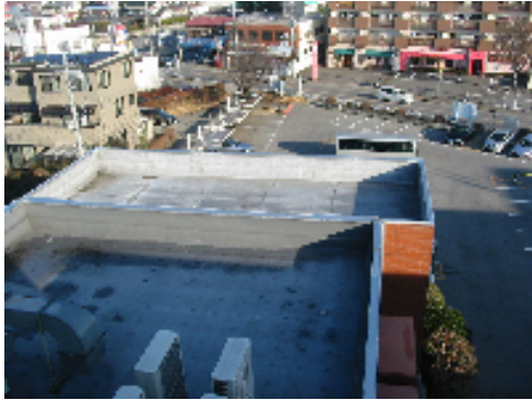
アイリスホール屋上改修前現況写真