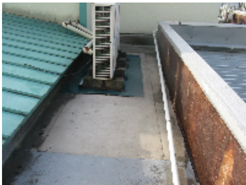
大ホール屋上西側の改修前写真