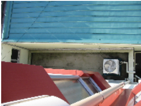
大ホール接続部の改修前の既存写真