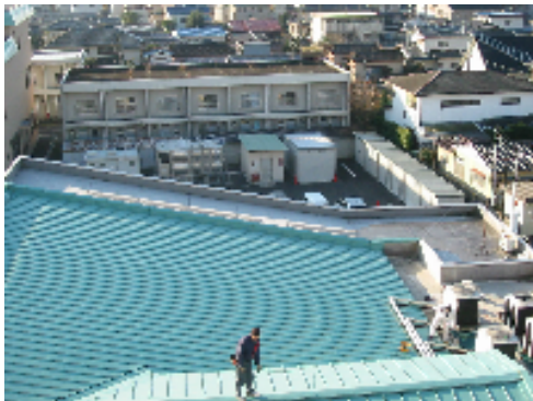
大ホールステージ屋上の現況写真