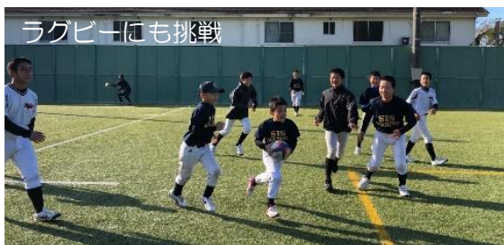
ラグビーにも挑戦