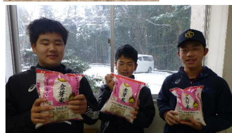
「JＡしまね」様から提供して頂いた沢山の金芽米