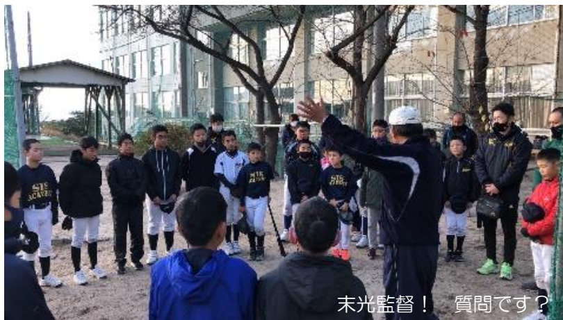
末光監督！ 質問です？