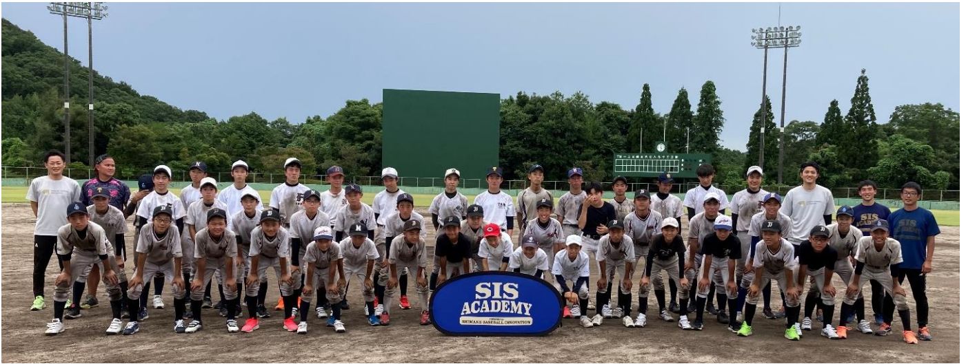
2021. 7. 18、宍道球場（松江市）における活動状況を、ベースボールマガジン社（ベースボールクリニック）から取材受けしました。