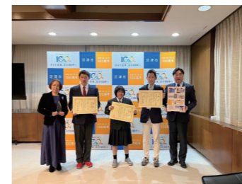
沼津市長 表敬訪問