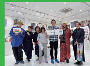
山下施設長とギャラリーにて