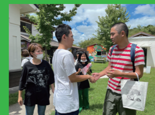
憧れの作家さんと握手