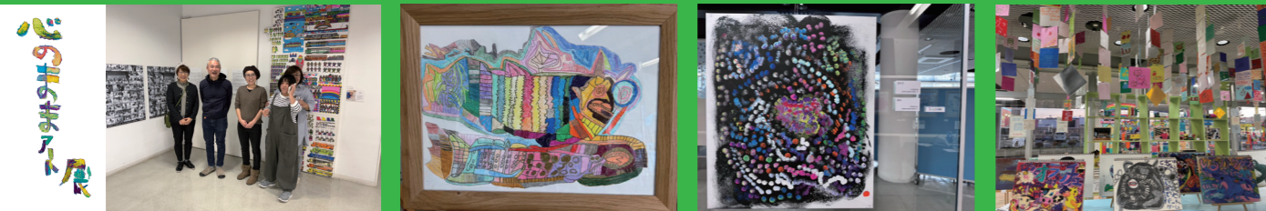
企業賞へのご協力をいただきありがとうございました