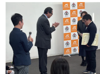
「ふじのくに地域づくり創造賞」表彰式