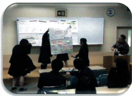
過去の講座の様子

毎年2月に名古屋大谷高等学校で医療福祉コースの学生さんを対象に開催していた“みずほたすけ愛ネット主催「認知症について学んで一緒に地域を支えよう」”昨年度は新型コロナウイルス感染者数が急増し、愛知県「まん延防止等重点措置」の発出したこともあり、中止になりました。今年は2月25日（金）で25名の学生さんを対象に準備を進めています。本稿の締め切りの都合で、開催報告は次号（第111号（令和5年5・6月号））でさせていただきます。