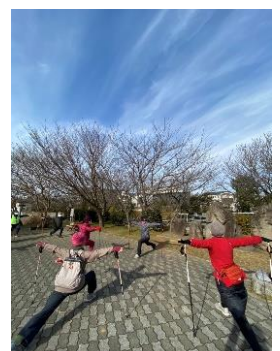
「大人のミニ遠足」の様子