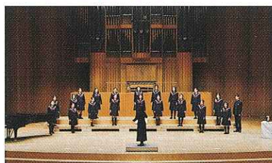
パイプオルガン学園、松江プラバ室内合唱コンクールなど