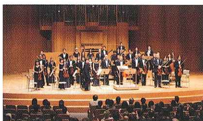
松江プラバ音楽祭など