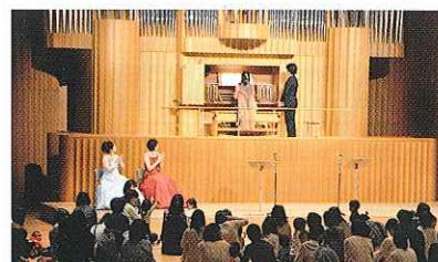
子どもたちのための事業、公演企画支援など